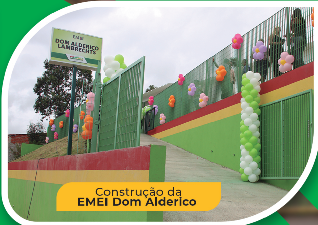
Construção da EMEI Dom Alderico