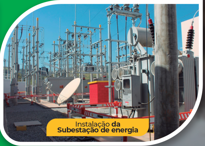
Instalação da Subestação de energia