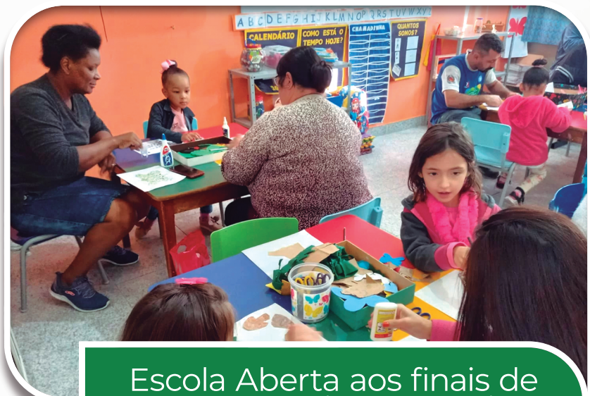
Escola Aberta aos finais de semana " Projeto Parceiros do Futuro nas Escolas "