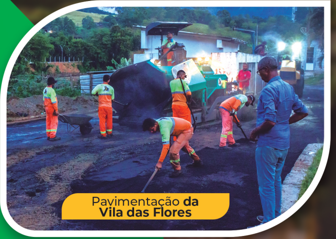
Pavimentação da Vila das Flores