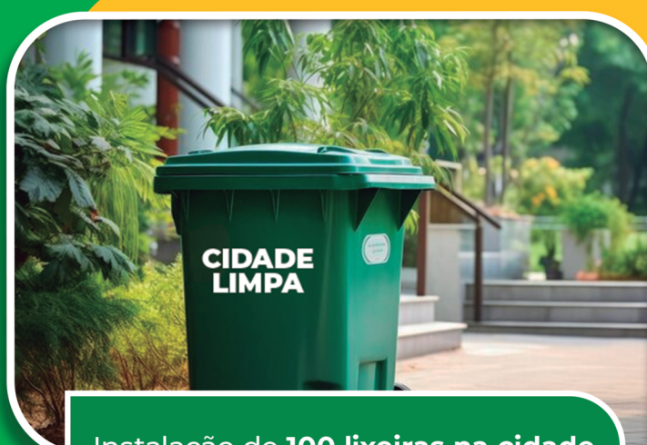
Instalação de 100 lixeiras na cidade e programa de plantio de árvores