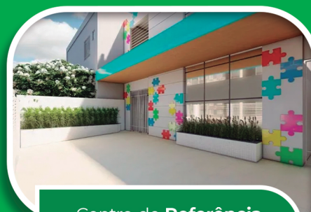
Centro de Referência do Autismo