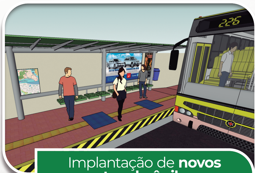
Implantação de novos pontos de ônibus e revitalização dos escadões