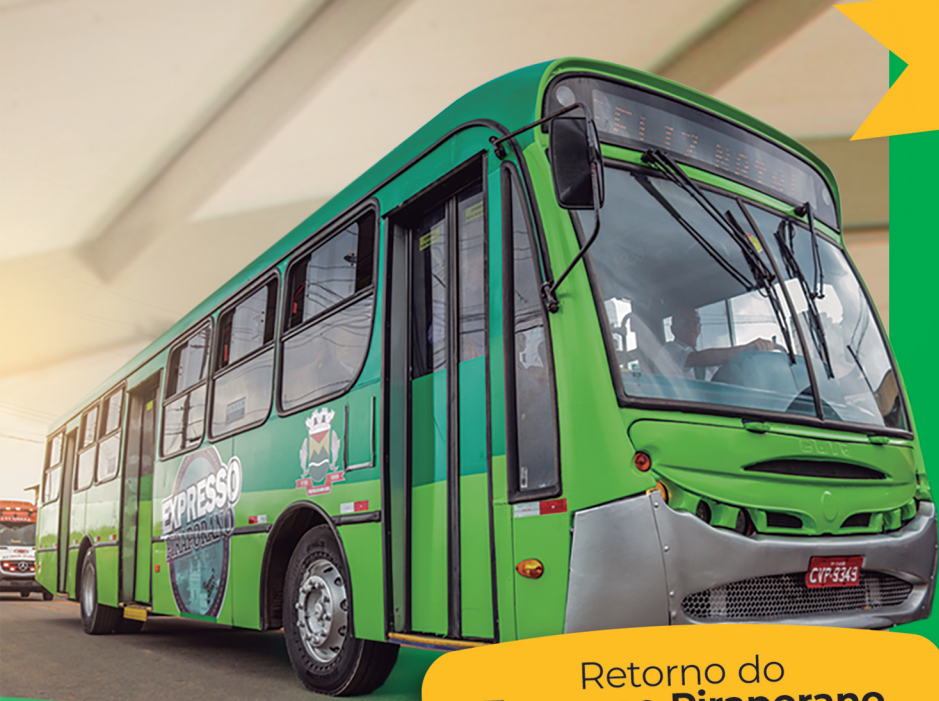
Retorno do Expresso Piraporano