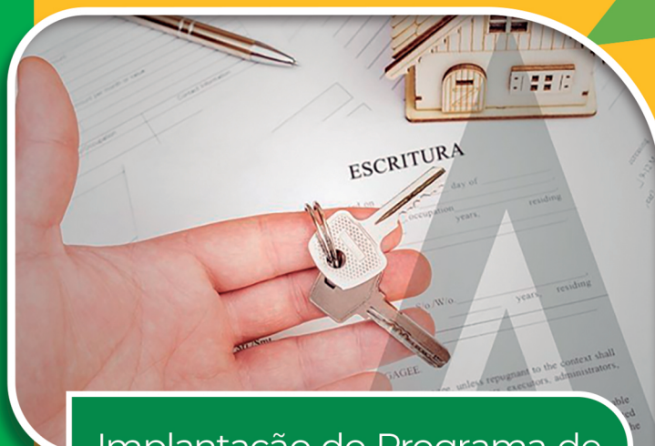
Implantação do Programa de Regularização Fundiária

CNPJ Candidato 56.470.314/0001-02 | CNPJ Gráfica 01.692.620/0001-00 | Tiragem 500 unidades