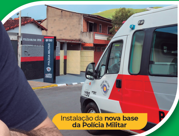
Instalação da nova base da Polícia Militar