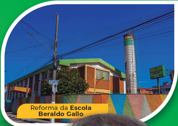
Reforma da Escola Beraldo Gallo