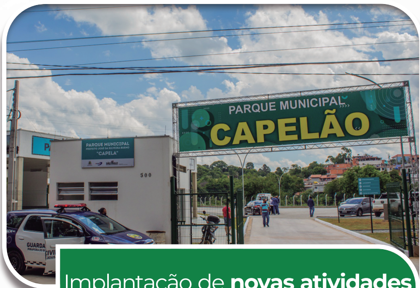
Implantação de novas atividades no Parque Municipal Capelão