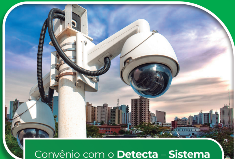
Convênio com o Detecta – Sistema de Monitoramento por câmeras nos Portais de entrada e saída da cidade