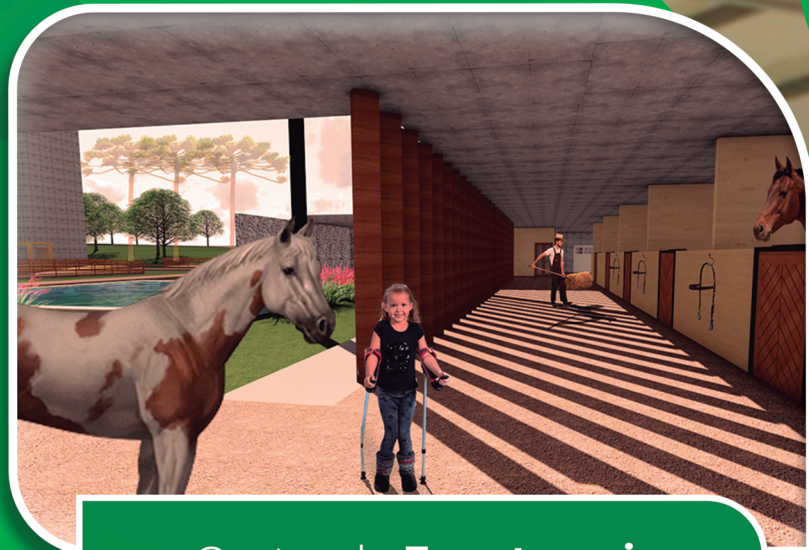
Centro de Equoterapia