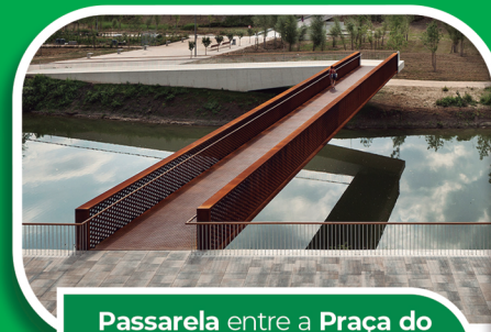
Passarela entre a Praça do Encontro e o Portal dos Romeiros