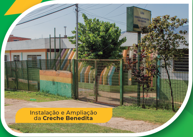
Instalação e Ampliação da Creche Benedita