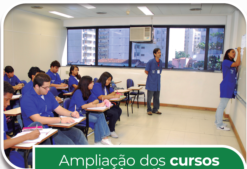
Ampliação dos cursos profissionalizantes no CRAS