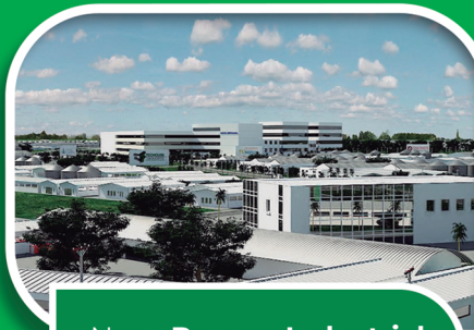
Novo Parque Industrial