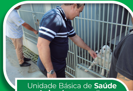
Unidade Básica de Saúde Animal com canil e feira de adoção