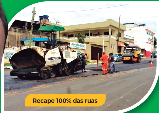
Recape 100% das ruas