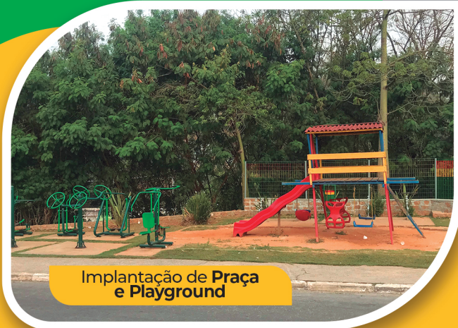
Implantação de Praça e Playground

PREFEITO GREGORIO VICE: LUCIANO MOTORISTA