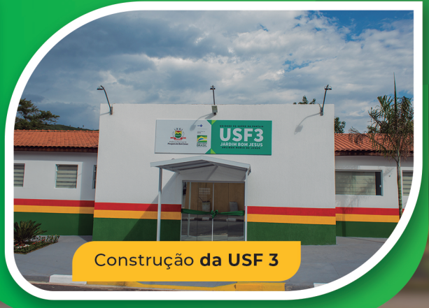
Construção da USF 3