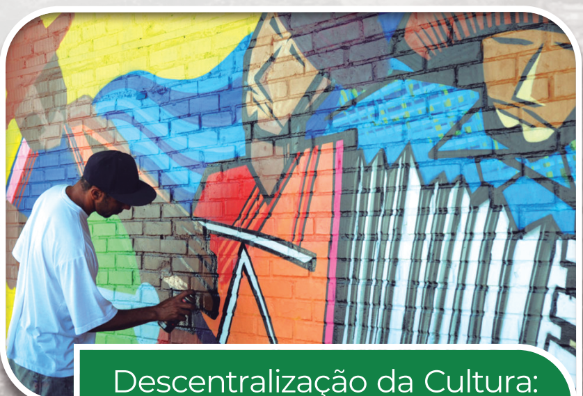
Descentralização da Cultura: cursos diversos, hip hop e arte na rua