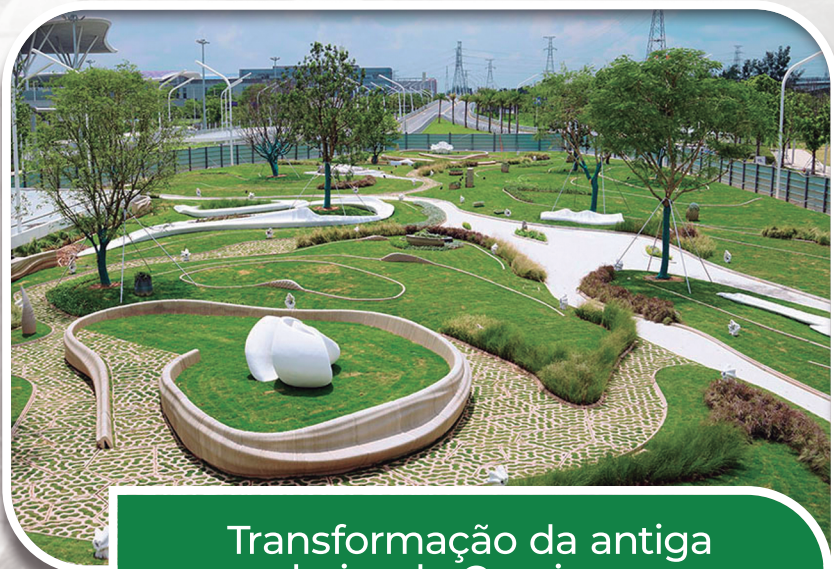
Transformação da antiga pedreira da Cominge em Parque Ecológico Municipal